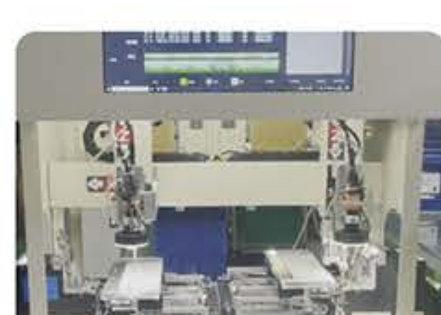
双工位零配件 螺丝锁付行业