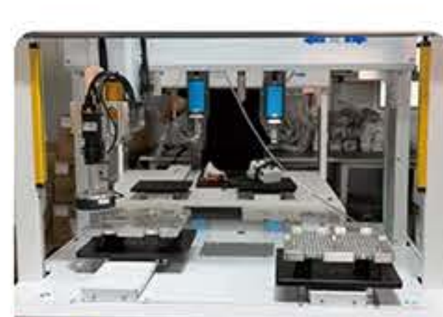
屏幕中框 螺丝锁付行业