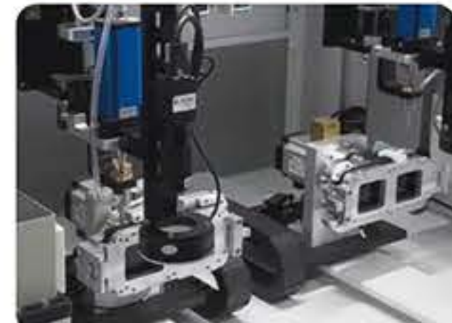
智能手机 螺丝锁付行业