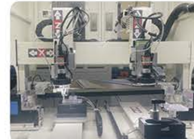
电脑外设产品 螺丝锁付行业