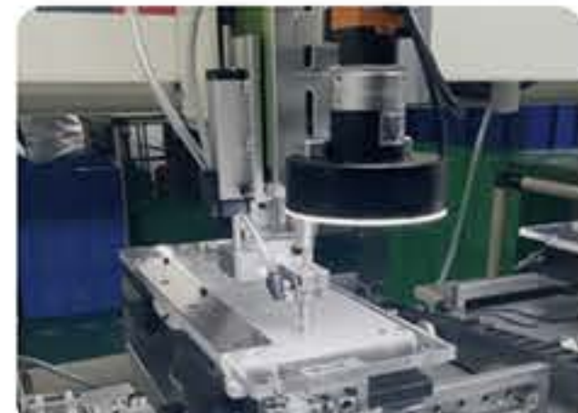
机械键盘 螺丝锁付行业