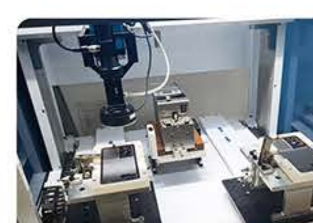
手机盖板 螺丝锁付行业